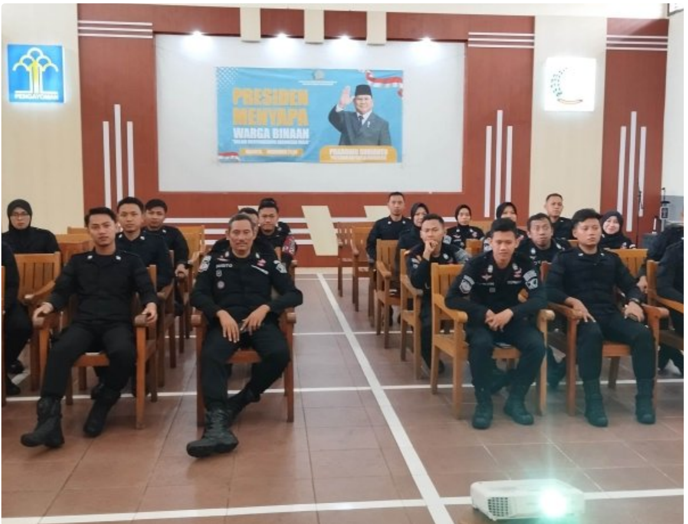
Rutan Blora Ikuti Sosialisasi Pedoman Uji Kompetensi Jabatan Fungsional Pembina Keamanan dan Pengaman Masyarakat

Blora - Rumah Tahanan Negara (Rutan) Kelas IIB Blora turut berpartisipasi dalam kegiatan Sosialisasi Pedoman Uji Kompetensi Jabatan Fungsional